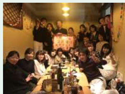
五軒町診療所職員一同

このように明るい職場をつくり、その結果、五軒町の目標である「もう一度、眼科にかかるなら五軒町で」と思っただけのようにする事を心がけて、今後も努力してまいります。